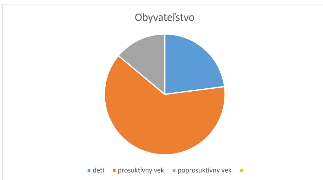
Tab. Č. 3 Sociologické údaje

Zdroj : Evidencia obyvateľov Obce Oreské